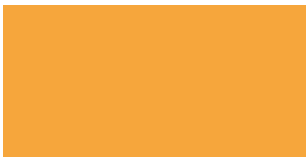
NEON ORANSSI PUOLIKIILTÄVÄ