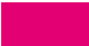
NEON PUNAINEN PUOLIKIILTÄVÄ