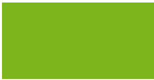
NEON VIHREÄ PUOLIKIILTÄVÄ