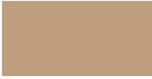
CAMO BEIGE MATTA