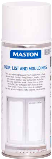
NCS S 0502-Y